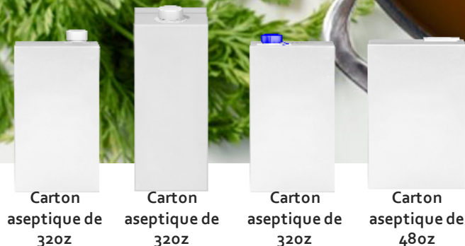
Carton aseptique de 32oz